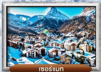
เซอร์แมท

บินทรู สายการบิน Full Service | พิเศษ! ล้มลองฟองดู 3 ชนิด