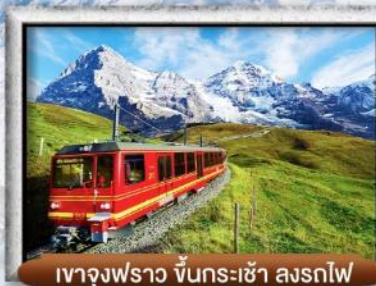
เขา Jungfrau ขึ้นกระเช้า รถไฟ