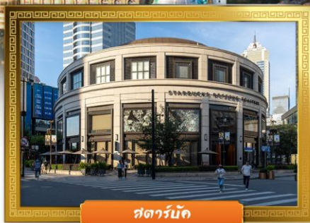
สตาร์ไลน์