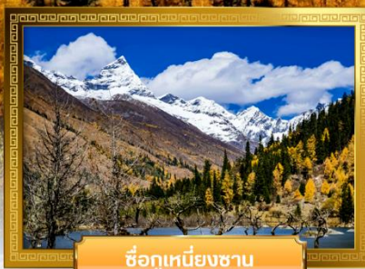
ชื่อกุเหนียงซาน