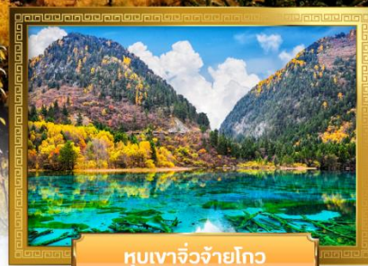
หุบเขาจิวจ้ายโกว