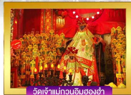
วัดเจ้าแม่กวนอิมสองฮ่า