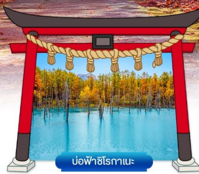
บ่อฟิชิโรทานะ