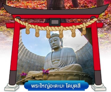
พระใหญ่อะตะมะ ไดบุตสึ