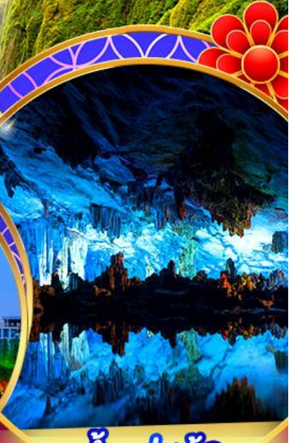
ถ้ำลุ่ยอ้อ