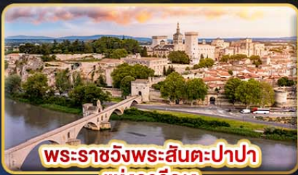
พระราชวังพระสันตะปาปา แห่งอาวิญญ