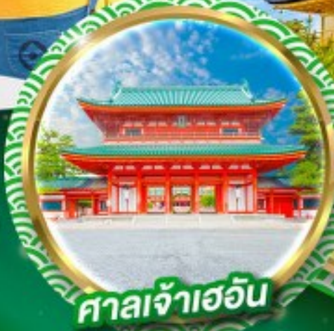
ศาลเจ้าเฮอัน