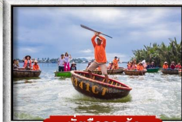
นั่งเรือกระดัง