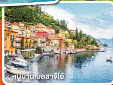
หมู่บ้านเบลลาจีโอ