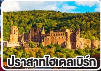
ปราสาทไฮเคิลเบิร์ก