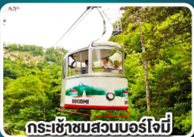
กระเช้าชมสวนบอร์โจมี