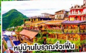
หมู่บ้านโบราณจิวเฟิ่น