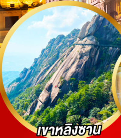
เงาหลิงซาน