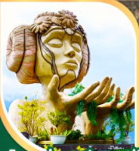
โมอาน่า ซาปาคาเฟ่