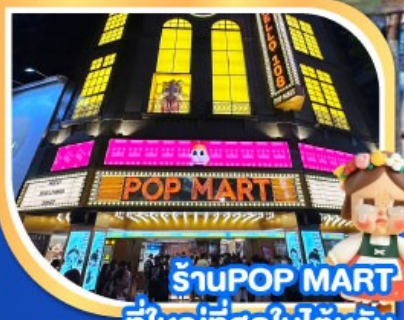
ร้านPOP MART ที่ใหญ่ที่สุดในไต้หวัน