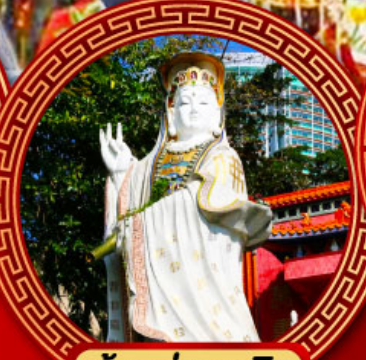
เจ้าแม่กวนอิม รัฟัสเบย์