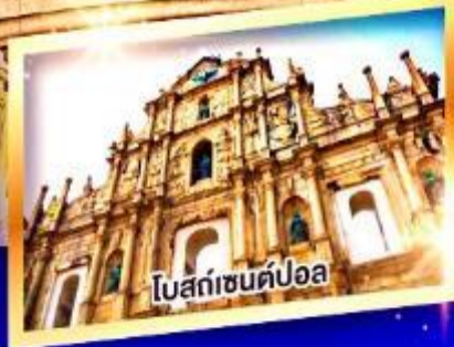
โบสถ์เซนต์ปอล

เมนูพิเศษ ห่านย่าง, ต้มชาฮ่องกง, บุฟเฟ่ต์สไตส์ฮ่องกง