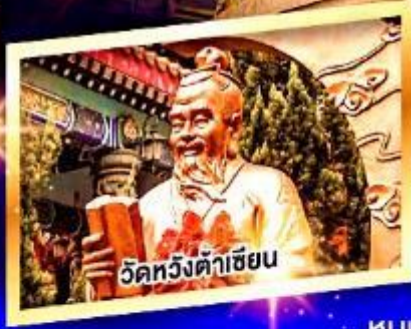
วัดหวังต้าเซียน