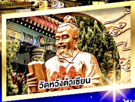
วัดหวังต้าเซียน