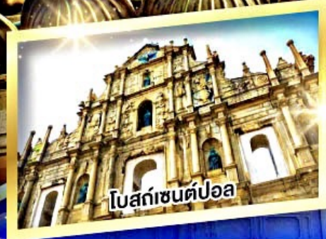
โบสถ์เซนต์ปอล

เมนูพิเศษ ห่านย่าง, ต้มข้าวฮ่องกง, บุฟเฟ่ต์สไตล์ฮ่องกง