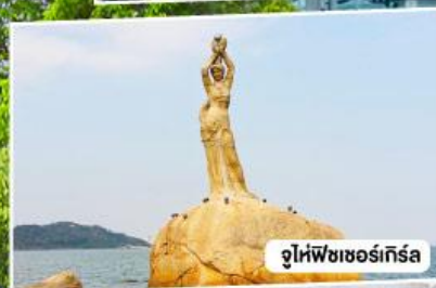
จูไห่ฟิชเชอร์เกิร์ล