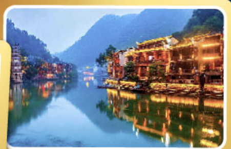
เมืองโบราณฟิ่งหวง