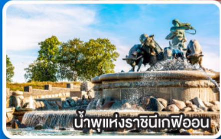
น้ำพุแห่งราชินีทิพออน