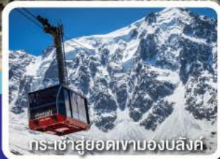
กระเช้าสู่ยอดเขามองบล็องค์

พิสุจน์ความสูง ของสองเงา Top of Europe ยอดเขาจุงเฟรา และยอดเขามองบล็องค์