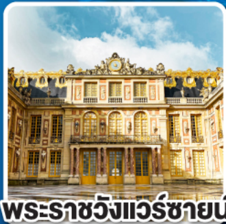
พระราชวังแวร์ซายน์