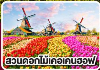
สวนดอกไม้เคอเคนฮอฟ