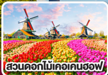
สวนดอกไม้เคอเคนฮอฟ

ดอกไม้ที่สดใส กับ หัวใจที่เบิกบาน ฝรั่งเศส เบลเยียม ลักเซมเบิร์ก เยอรมนี เนเธอร์แลนด์ 8 วัน 6 คืน