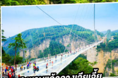
สะพานแกว่งฉางเจียเจีย