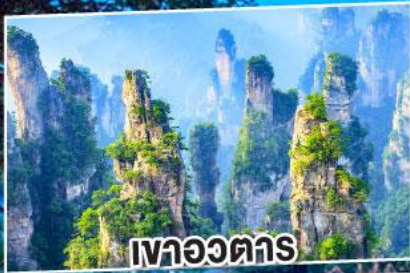
เขาวงตาร