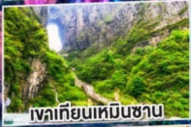
เวาเทียนเหมินซาน