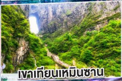
เขาคิเยนเหมินซาน