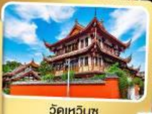
วัดเหวินชู่