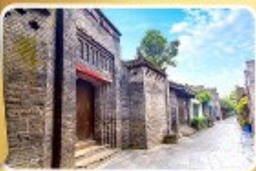
ถนนโบราณซอยกว้างซอยแคบ