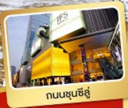
ถนนชุนชิลู่