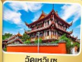
วัดเหวินชู่