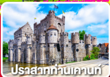
ปราสาทท่านเคานท์