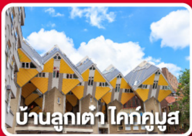
บ้านลูกเต่า โคท์กูบูส