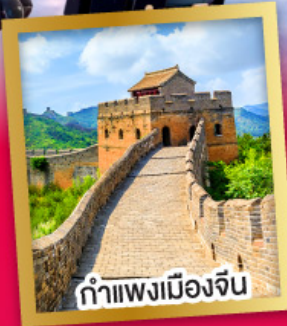
กำแพงเมืองจีน