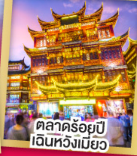
ตลาดร้อยปี เงินหวังเหมียว