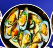
หอยแมลงภู่อบไวน์ขาว