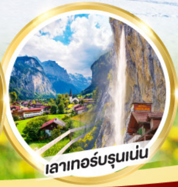
เลาเทอร์บรุนเน่น