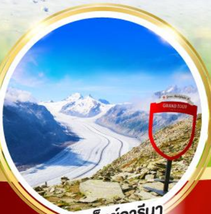
อาเล็กซ์อาร์นา