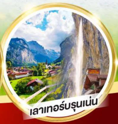
เลาเทอร์บรุนเนน