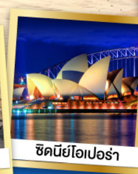
ซิดนีย์โอเปร่า