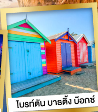
ไบรด์ตัน บาร์ตัง บ็อกซ์