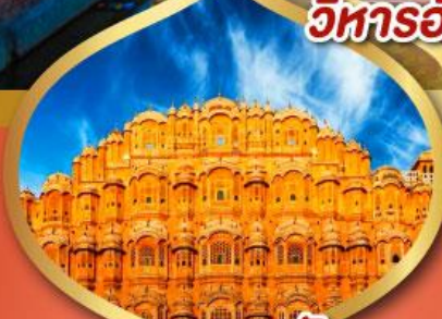
พระราชวัง สายลม