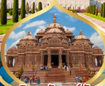
วิหารอักชาร์ดัม