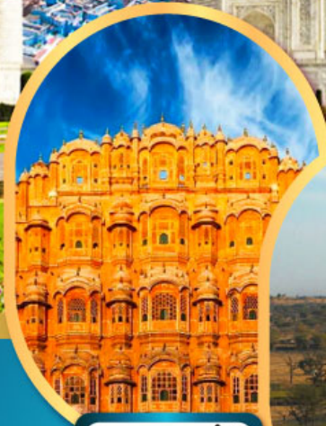
พระราชวัง สายลม