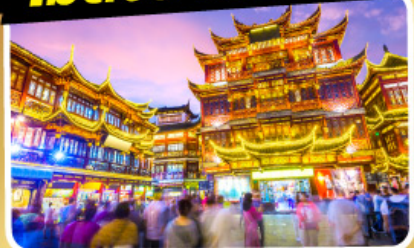
ตลาดร้อยปีเฉิงหวังเมี่ยว