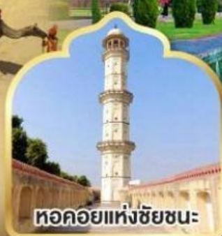
หอคอยแห่งชัยชนะ