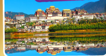
วัดลามะชงจ้านหลิง