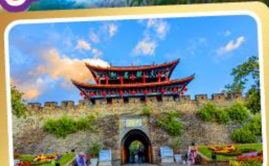
เมืองโบราณต้าหลี่