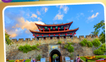
เมืองโบราณต้าหลี่