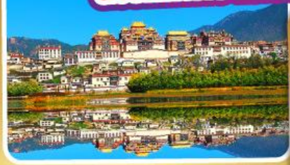
วัดลามะชงจ้านหลิง