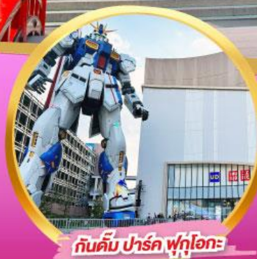
กันดั้ม ปาร์ค ฟุกุโอกะ