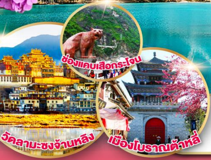
ชื่องานเลือกกระโจน