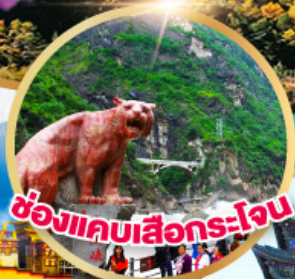
ช่องแคบเสียนโง