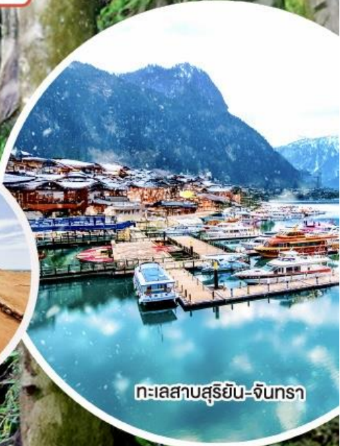
ทะเลสาบสุริยัน-จันทรา