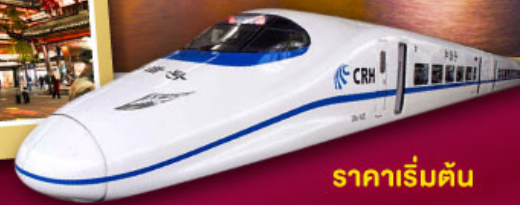
ราคาเริ่มต้น