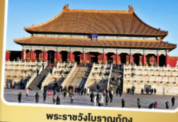
พระราชวังโบราณกู้กง