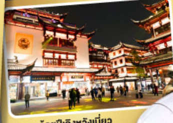
ตลาดร้อยปีเฉิงหวงเหมียว