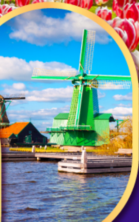
หมู่บ้านกังหันลมชาสคันส์

08-16 ก.พ.68 09-17, 10-18 เม.ย.68 23 เม.ย.-01 พ.ค.68