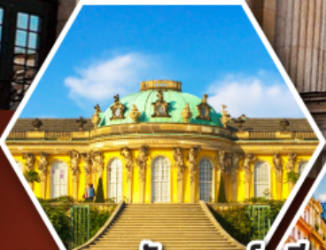
พระราชวังซงส์ซูซี