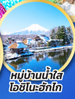
หมู่บ้านน้ำใส ไอชิโนะอึกิ