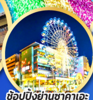
ช้อปปิ้งย่านซากาเอะ