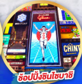
ช้อปปิ้งชินโซบาชิ