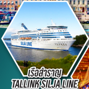
เรือสำราญ TALLINK SILJA LINE