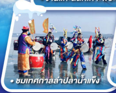
• ชมเทศกาลล่าปลาน้ำแข็ง