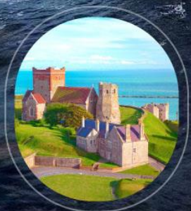
United Kingdom Dover