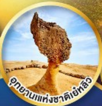
อุทยานแห่งชาติเย่หลิว