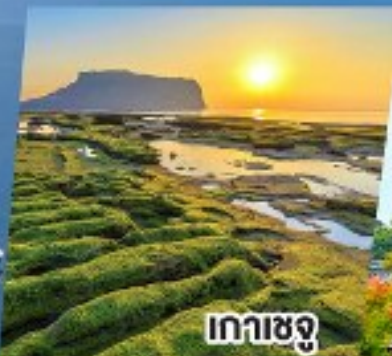
เกาะเชจู