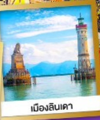
เมืองลินเคา